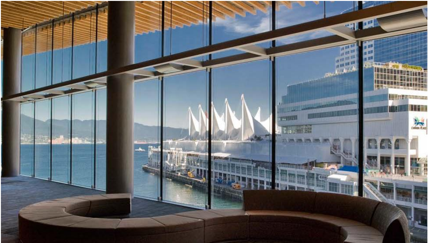
Vancouver Convention Centre (kongresové centrum) - SGG DIAMANT