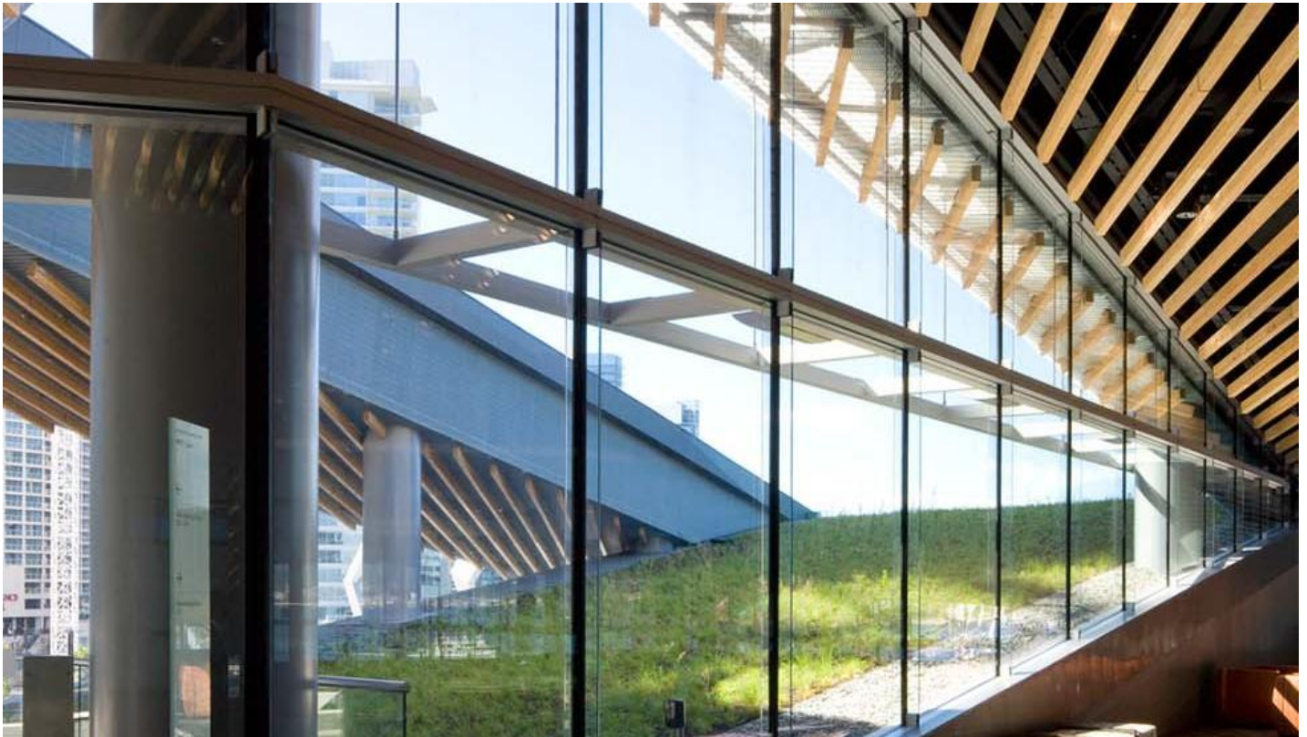
Vancouver Convention Centre (kongresové centrum) - skleněná fasáda