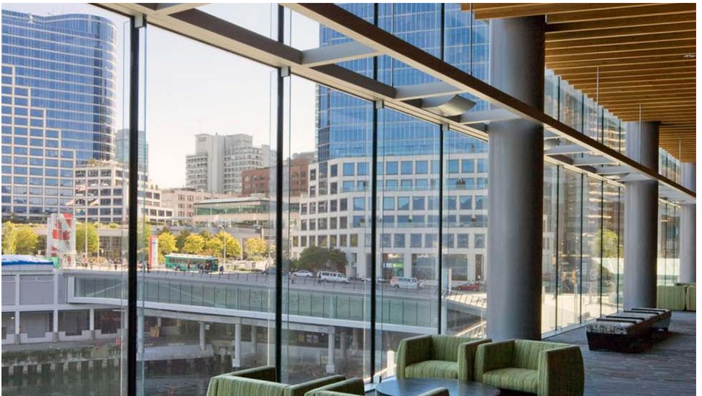
Vancouver Convention Centre (kongresové centrum) - prosklená fasáda