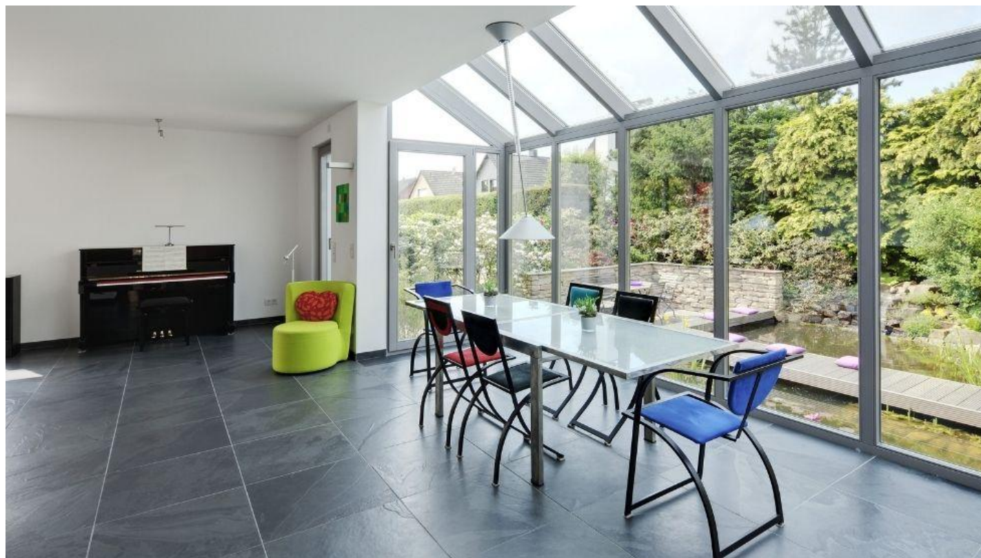
BIOCLEAN Samořisticí sklo