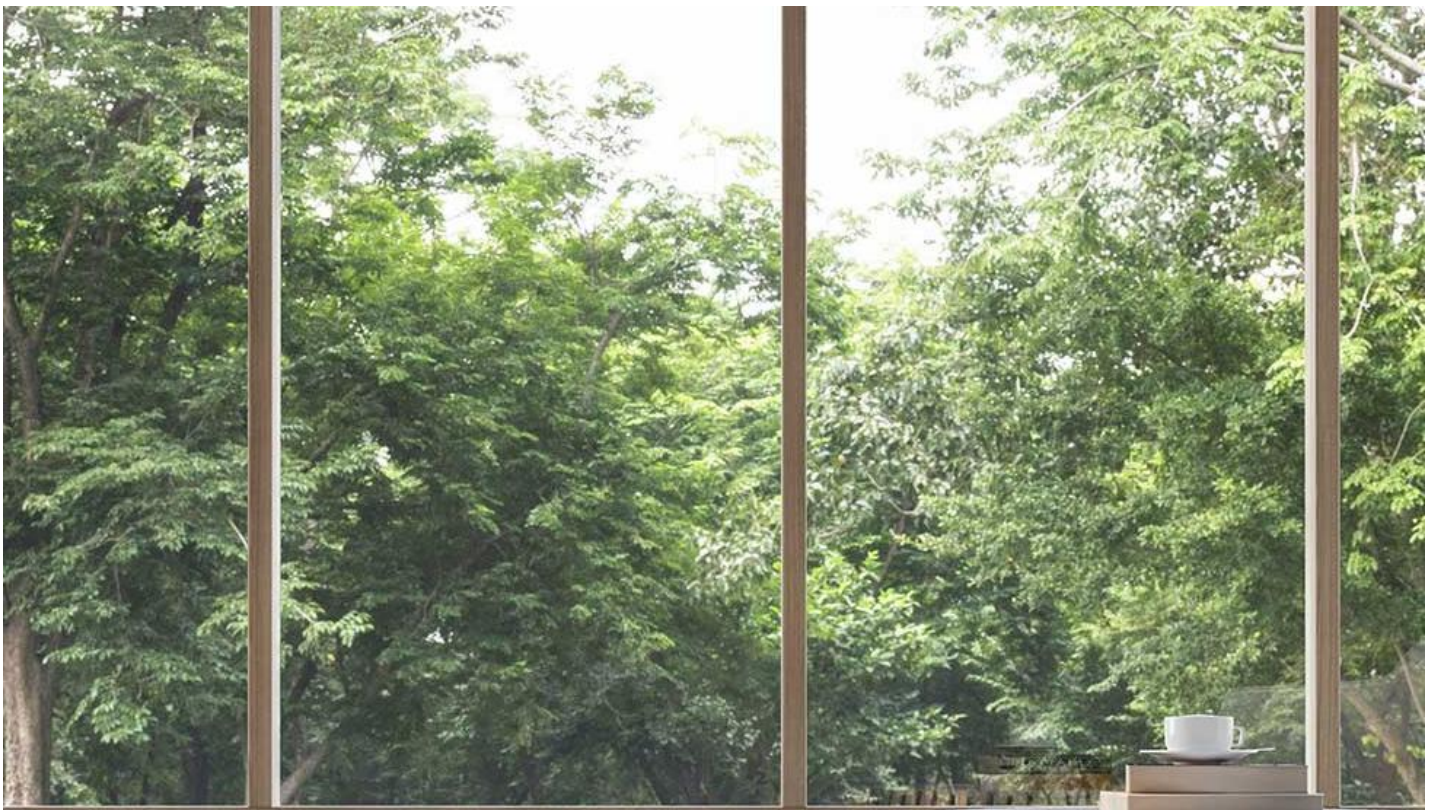
BIOCLEAN Samořisticí řiré sklo