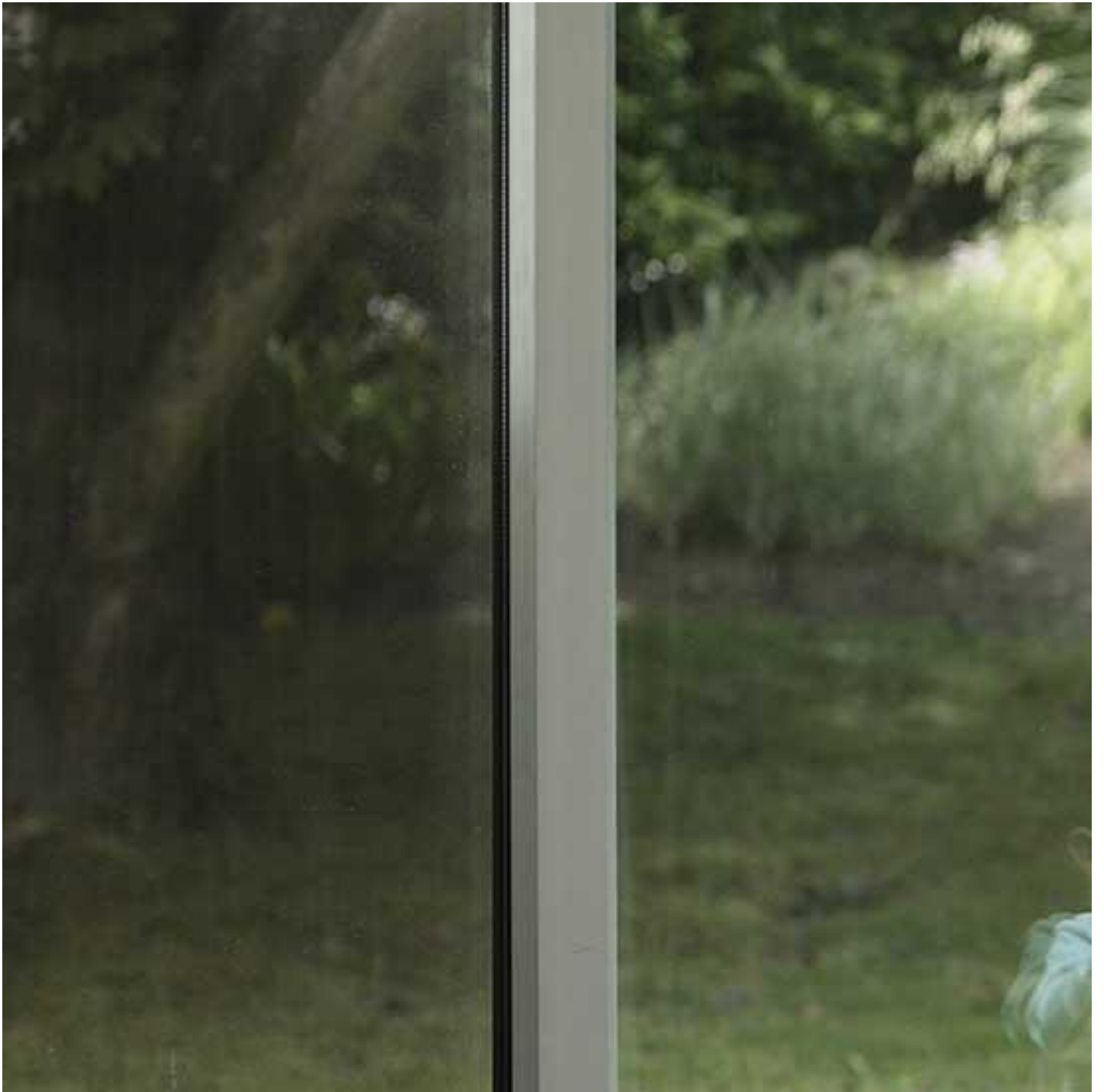
SGG STADIP®/SGG STADIP PROTECT®