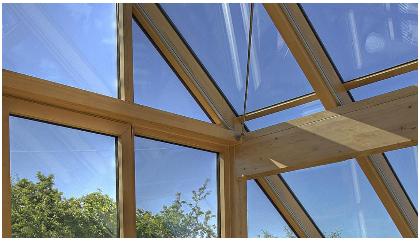
BIOCLEAN samočisticí sklo na terasu